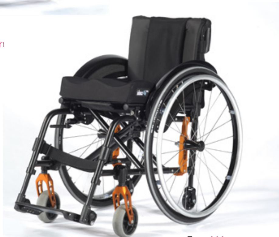
Easy 200 fixer Vorderrahmen

In drei Rahmen-Längen und mit den besten Voraussetzungen für die nötige Individualität. Der Easy 200 in seiner kompakten Bauweise ist der Klassiker im Faltrollstuhl-Segment.