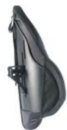
// Mid Deep Contour (MDC)