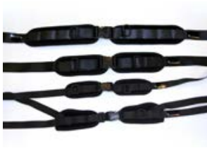
// CIR090135/CIR090136/ CIR090156